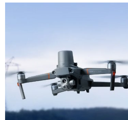
DJI Mavic Enterprise multispettrale