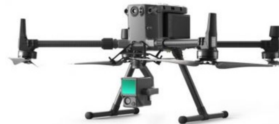
DJI Matrice 350 con L2